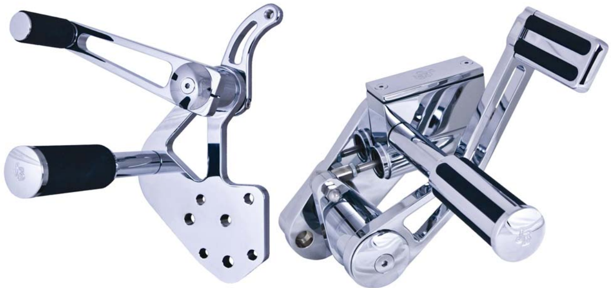
Ausführung Classic Slotted Series