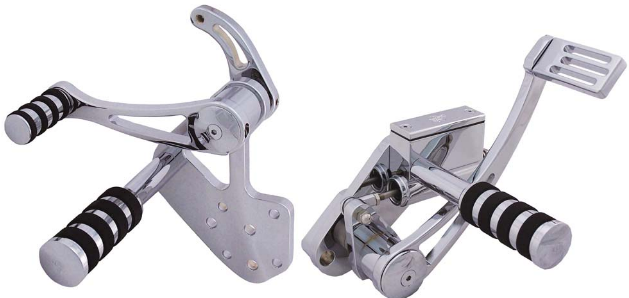
Ausführung Radial Slotted Series