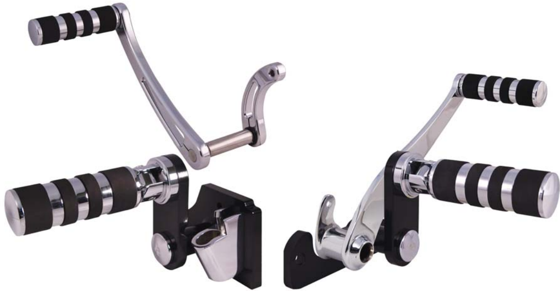
Ausführung J-FL Series