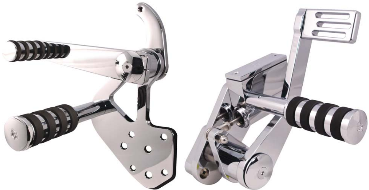
Ausführung Classic Solid Series